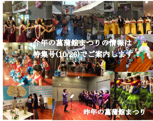
今年の菖蒲館まつりの情報は 特集号(10/26)でご案内します