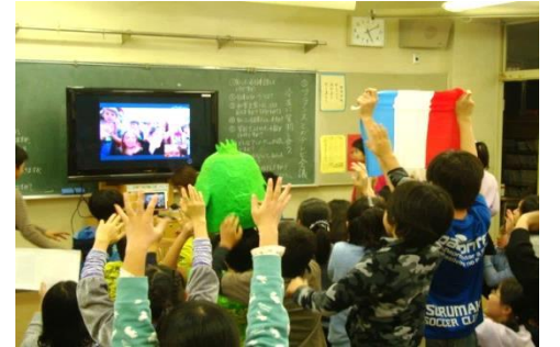
フランスとのテレビ会議の様子

また、地域やグリーンライブセンターの方々の手ほどきで、藍染め体験を継続しています。藍を種から育て、収穫し、乾燥させた葉を煮込み、染色液を作ります。その液で一人ずつ日本手ぬぐい大の布を染め、近くに工場がある(株)JUKIの方々の指導でミシンを使って縫い合わせ、70mほどの一枚の布にして展示会場に飾ったこともありました。