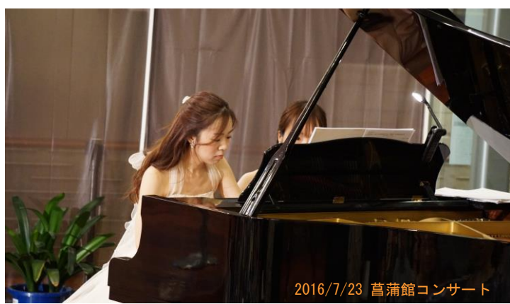
2016/7/23 菖蒲館コンサート